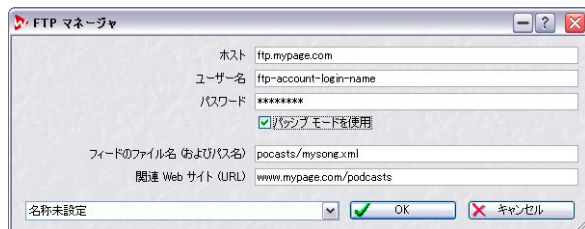
"FTP マネージャ (FTP site)" ダイアログ

WaveLab の FTP サイトマネージャーは、Podcast のアップロード処理に必要なすべての情報を用意しています。Podcast ウィンドウの "公開 (Publish)" メニューから "FTP マネージャ (FTP site)" を選択すると、"FTP マネージャ (FTP site)" ダイアログが開きます。