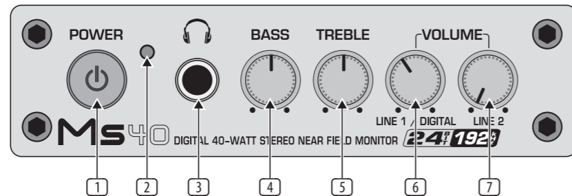
前面の操作機構 (右ボックス)