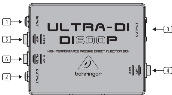
Fig. 1: vista dall'alto