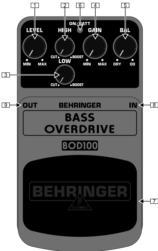
Обзор верхней части