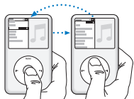
Escolha um item.